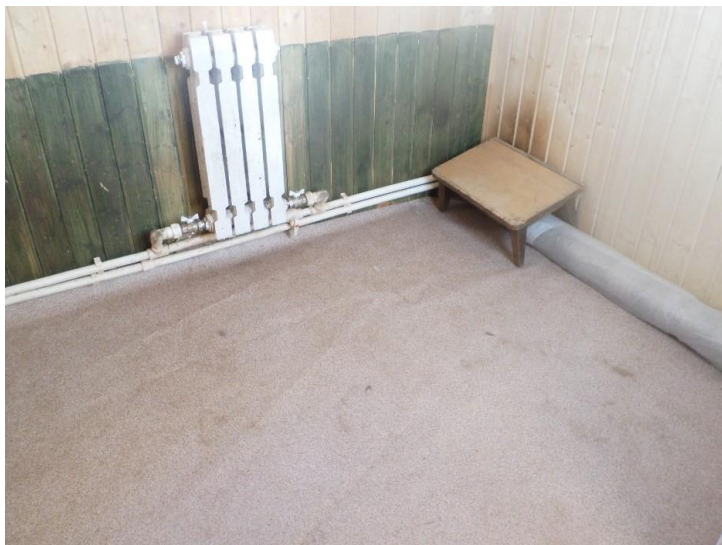
Hundrum efter renovering